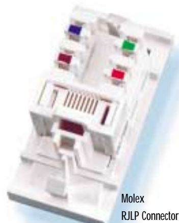
Molex RJLP Connector

NAŠE 25-LETÁ ZÁRUKA KVALITY PRODUKTŮ JE JEDNOU Z NEJROZSÁHLEJŠÍCH ZÁRUK NA TRHU STRUKTUROVANÝCH KABELÁŽÍ A PŘEDČÍ "SYSTÉMOVÉ ZÁRUKY" MNOHA JINÝCH FIREM.